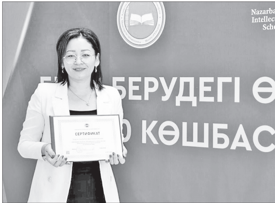
Nazarbaev Intellect School

Қалай дейсіз бе? Біз педагогикалық шеберлік орталығы және EdCrunch Academy мәскеулік ІТ сарапшылары өзірлеген «Заманауи мектепті басқару» компьютерлік