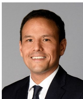
Cédric O, Secrétaire d'Etat chargé de la Transition numérique et des Communications électroniques

Le 29 mars 2018 au Collège de France, le Président de la République présentait sa vision et sa stratégie pour faire de la France un pays leader de l'intelligence artificielle. Nous arrivons aujourd'hui au terme de la première phase de cette stratégie nationale pour l'IA.