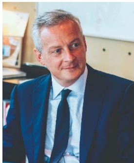
Bruno Le Maire, Ministre de l'Économie, des Finances et de la Relance